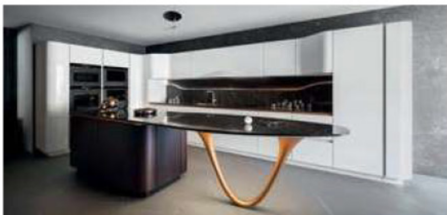
La cucina OLA, un'icona di Snaidero firmata Paolo Pininfarina, nel nuovo restyling del 2023.

presentato alcune delle sue cucine iconiche con nuovi materiali e finiture che ne elevano gli standard di qualità, con soluzioni tecniche contemporanee e funzionali in termini di durata e resistenza. La cucina OLA, ad esempio, è un'icona di design che continua a sedurre con le sue curve sinuose, per la bellezza e l'eleganza rassicurante propria degli oggetti che hanno superato la prova del tempo. Un esempio di unicità in grado di interpretare anche le tendenze più attuali, che ritrovano vivida espressione in volumi morbidi e profili curvi. Lanciata all'inizio degli anni '90 con la collaborazione di Paolo Pininfarina, che mette a punto un progetto pilota che attinge al mondo dell'automotive, la riedizione 2023 di OLA rimane fedele in termini di design all'originale, ma introduce novità progettuali che permettono un ulteriore livello di personalizzazione: i mobili, anche quelli ad ante curve, sono disponibili in una selezione di essenze di legno